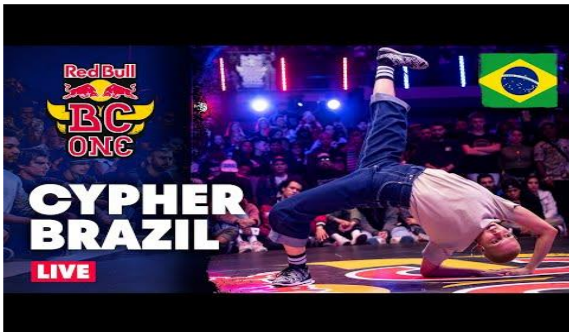
Red Bull One Cypher Brazil 2022 (duración: 3:23:53)

A continuación incluyo, completa, la Red Bull BC ONE Latam Cypher anterior :