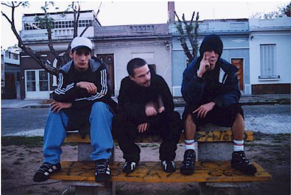
Víctimas del Sistema (VDS)