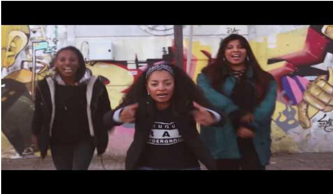
Se Armó Kokoa (SAK) (duración 4:05)

desde ahí siguieron juntas. Cuando pensaron en cómo las hacía sentir el nombre grupal dijeron: “Que se arme kokoa” y resultó un reconocimiento de sí mismas desde la negritud.