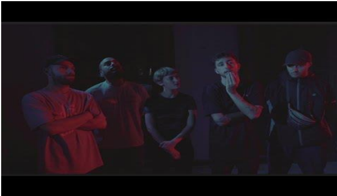
Así es mi barrio - 25 años de hip hop en Uruguay (duración: 1:42:29)

barrio – 25 años del Hip Hop en Uruguay 3 , (Realización: Nicolás Soto, Guión e investigación periodística: Gabriel Peveroni, Producción: Sergio Del Cioppo) donde, en compañía de El Quinto Elemento, muestra en detalle el recorrido de la cultura en el país y hay entrevistas a varios artistas importantes que pertenecen a las cuatro ramas del hip hop .