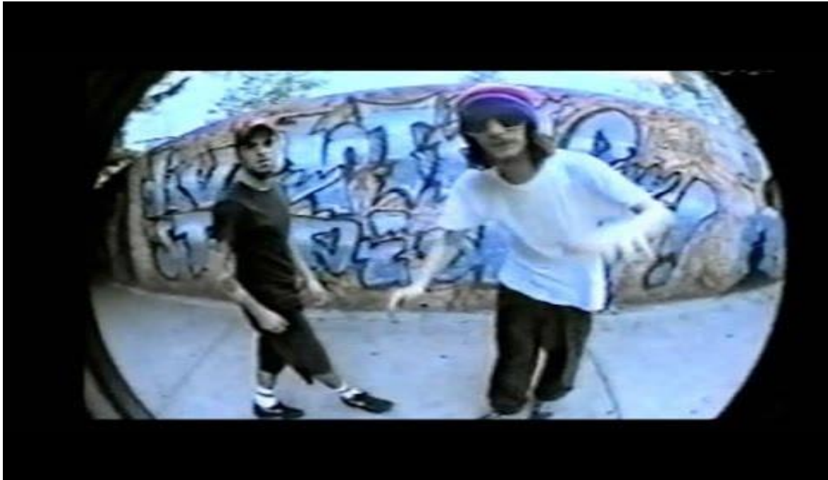
FUN YOU STUPID! – Uruguayanlocos - videoclip (duración: 4:30)