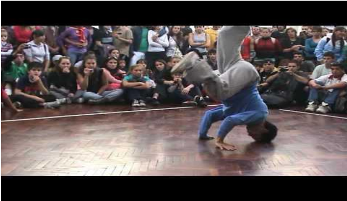
Duelo de estilos 2010 (breaking uruguay) (duración 3:39)

Las batallas siguen sin freno hasta la actualidad (un ejemplo es La Liga de la Terminal Breaking o Duelo de Estilos que termina este 2 de julio) y los participantes no paran de entrenar semana tras semana para prepararse a enfrentar próximas competencias. Aunque hay varias crews que tienen sus prácticas cerradas, existen espacios abiertos, gratuitos y semanales como la misma Casa INJU o Terminal Breaking (en la terminal Belloni) donde pueden ir tanto los b-boys ( breaking-boys ) experimentados estén o no en diferentes crews , como los novatos que quieren adentrarse en el largo y diverso recorrido del breaking .