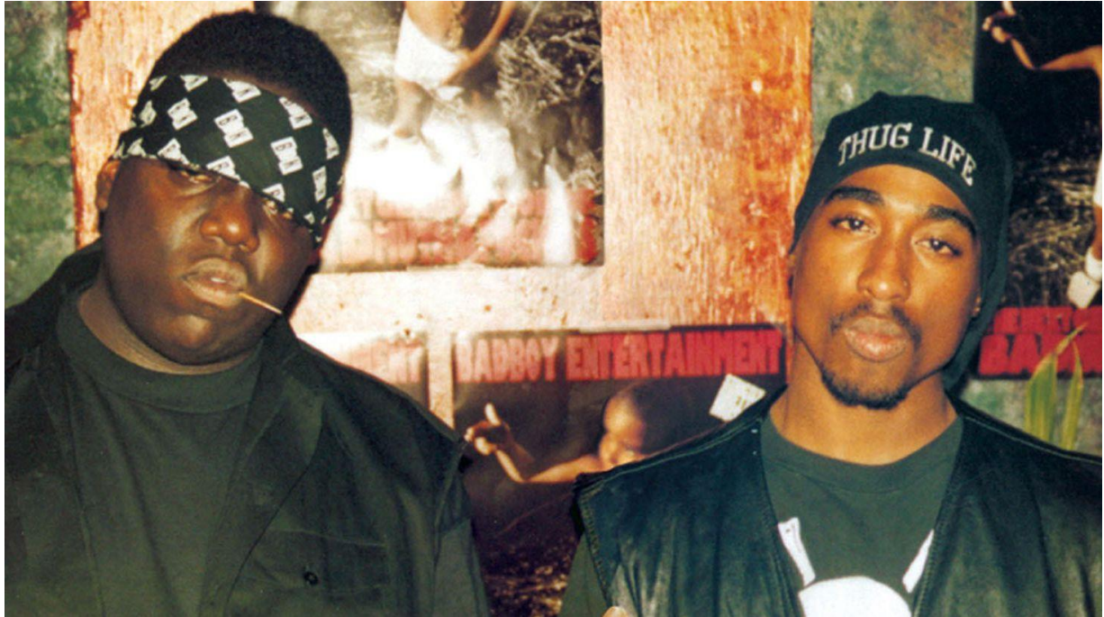
The Notorious B.I.G y Tupac Shakur